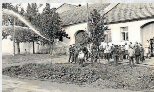
CVIČENÍ. Na snímku zachytil fotograf námětové cvičení hasičů v roce 1958.