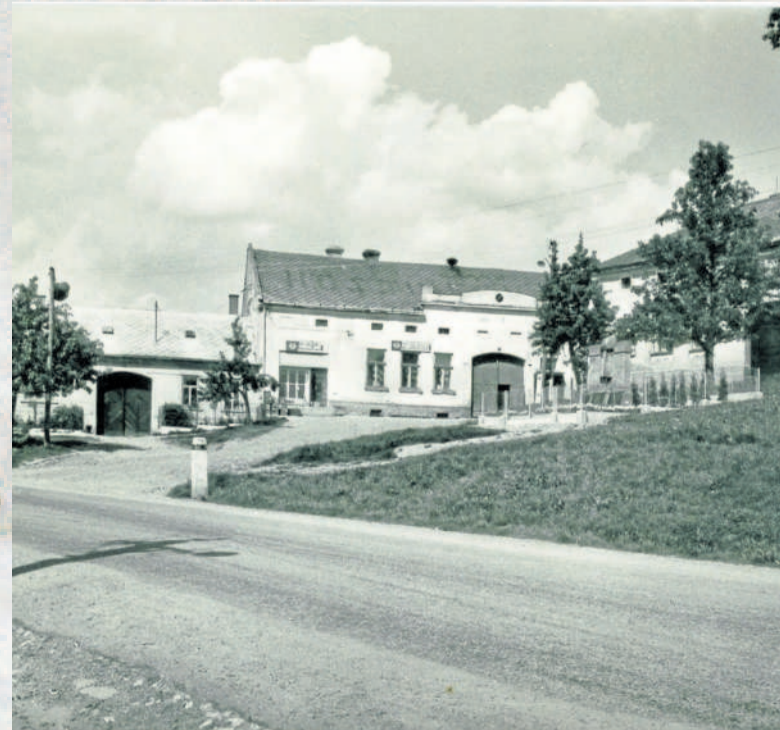
HOSPODA I OBCHOD. Uhřický pomník, obchod se smíšeným zbožím a hostinec u Rozbořilů zachycuje blíže nedatovaná fotografie.