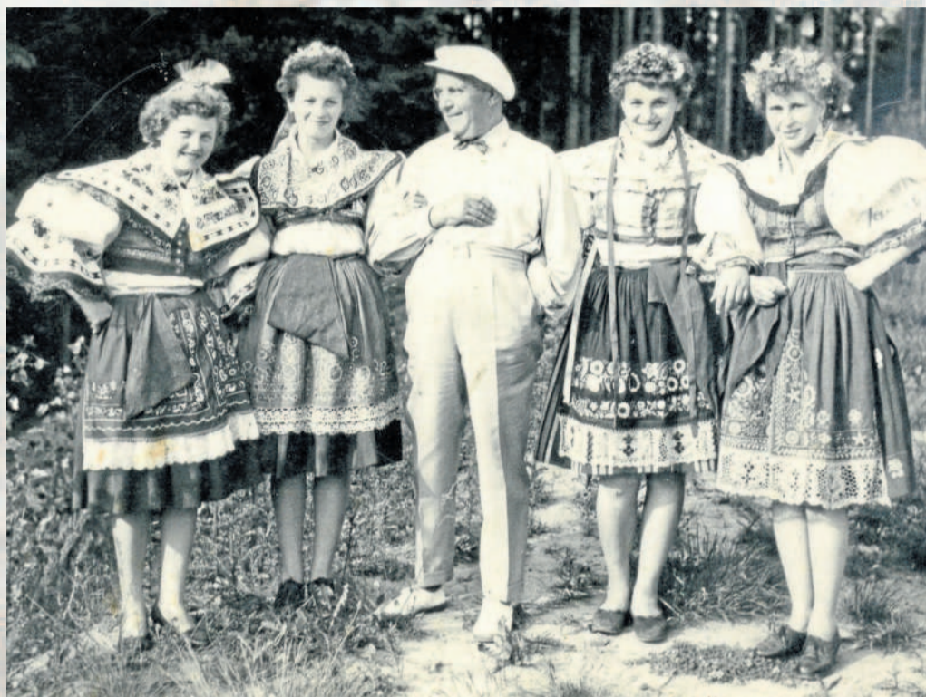
TRADICE. Místní ženy a dívky oblékly kroje při slavnostní příležitosti.

UHŘICE – Uhřice patří k nejstarším obcím Malé Hané. Podle archeologických nálezů spadají nejstarší stopy po osídlení obce do doby neolitu. První písemná zmínka o Uhřicích je z roku 1078, kdy je kníže Vratislav daroval klášteři hradištskému u Olomouce. Vesníci obklopují lesy, které jsou vyhledávaným místem pro houbaře a milovníky přírody. Historické snímky Uhřic jsou devětasedmdesátým dílem našeho seriálu Jak jsme žili v Československu.