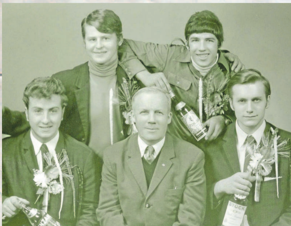
BRANCI. Místní mladí muži při odvodech v říjnu roku 1969.