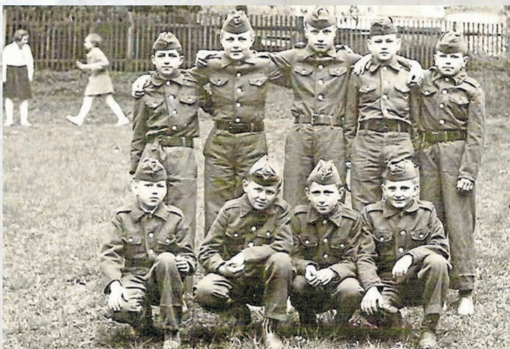
MLADÉ NADĚJE. Družstvo mladých hasičů zachytil fotograf v roce 1963.