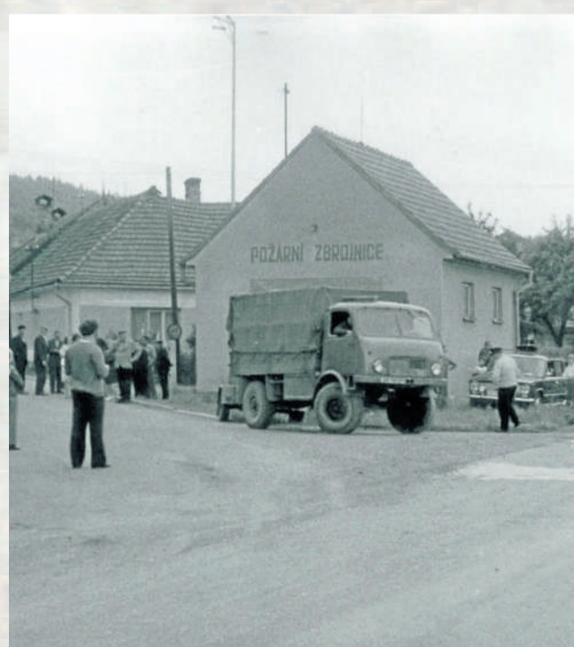
KAČENA. Na snímku stojí před zbrojnicí hasičské auto zvané Kačena.