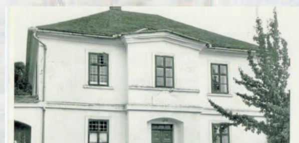
ŠKOLA. Školní budova stála v obci již roku 1863.