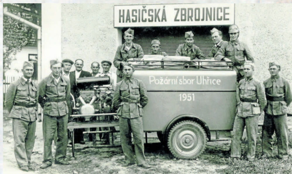
HASIČI. Místní hasiči společně zapózovali před zbrojnicí roku 1951.

UHŘICE – Uhřice patří k nejstarším obcím Malé Hané. Podle archeologických nálezů spadají nejstarší stopy po osídlení obce do doby neolitu. První písemná zmínka o Uhřicích je z roku 1078, kdy je kníže Vratislav daroval klášteři hradištskému u Olomouce. Vesníci obklopují lesy, které jsou vyhledávaným místem pro houbaře a milovníky přírody. Historické snímky Uhřic jsou devětasedmdesátým dílem našeho seriálu Jak jsme žili v Československu.